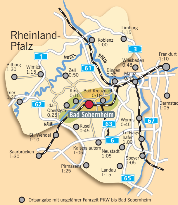
Ortsangabe mit ungefährender Fahrzeit PKW bis Bad Sobernheim

Museum: Mo. geschlossen, Di. – Fr. 9.00 – 18.00 Uhr, Sa. u. So. 11.00 – 17.00 Uhr Das Museum ist in den Wintermonaten geschlossen.